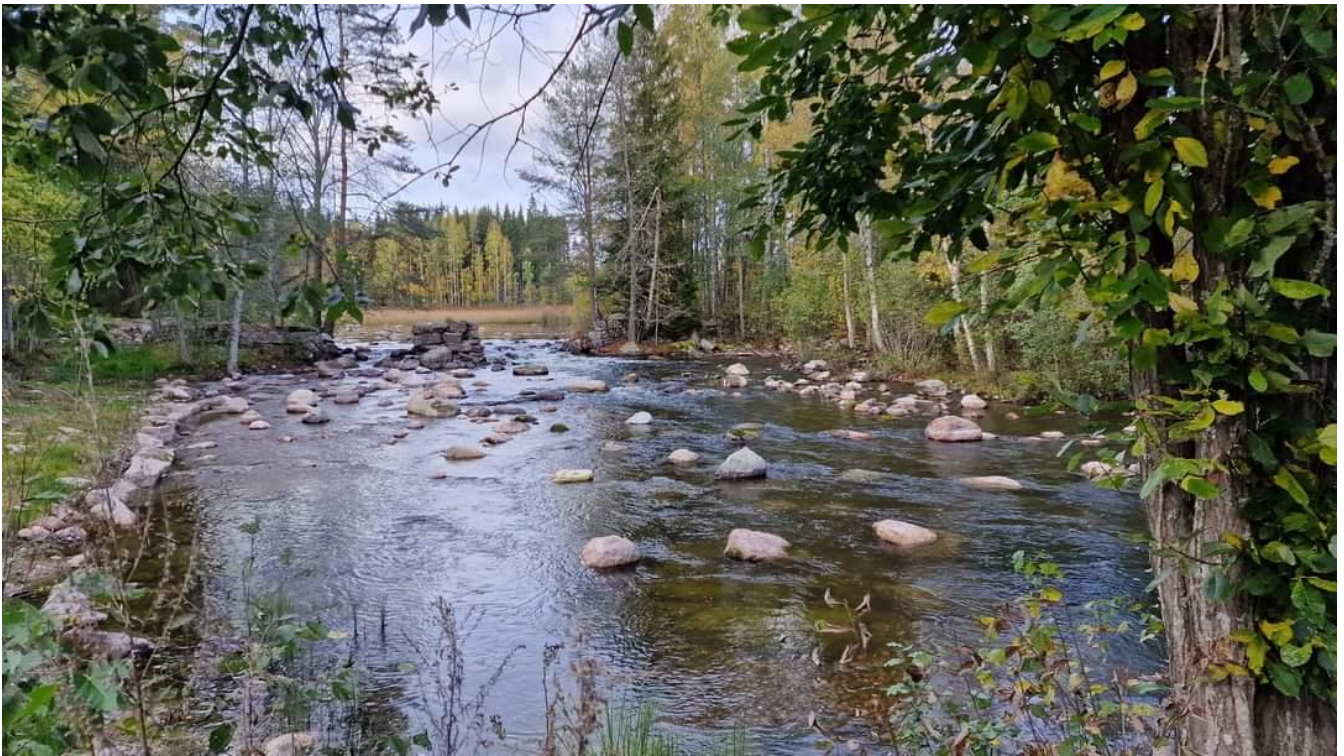
Mylykoski 7.10.2023